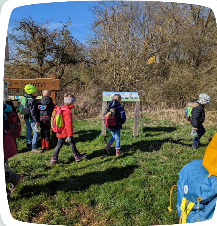
Ausflüge und Aktionen

Ferienbetreuung: Jeweils in der ersten Hälfte aller Ferien außer der Weihnachtsferien von 7.30-16:00 Uhr (gesonderte Anmeldung)